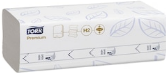
PREM MFLD TWL COMPRESD 1P WH 12 /200 420590