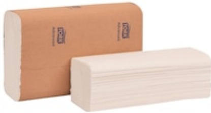
ADV MLTIFLD TWL 1 PLY WHT 16 /250 424824