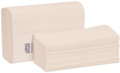
PREM MLTIFLD TWL 1 PLY WHT 12 /250 420580