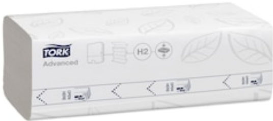
ADV MFLD TWL COMPRESD 1P WH 12 /250 424834